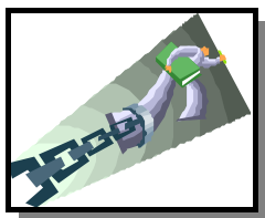
日本経済にデフレの足かせ

住宅投資を 2005 年、2010 年までそれぞれ 30%、50% 伸ばせるなら、2006 年まで成長を確保でき、その後増税によって財政赤字を減らす余力もできる。ビッグ・プッシュ政策を取った場合の実質成長率予測値は、2006 年までが 5%、それ以後 2010 年までは 3 ~ 4%。これだけ過剰貯蓄があるのに、歳出を減らす構造改革は事態を悪化させるほかない。